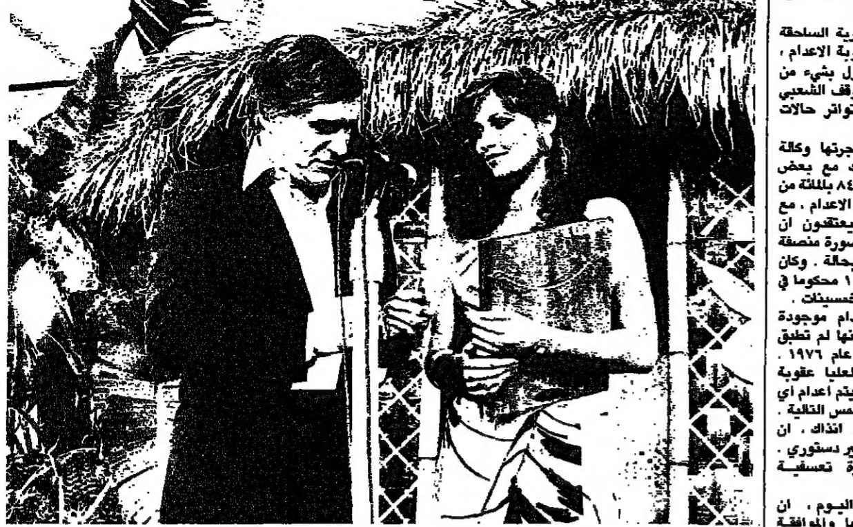
هوغ هيفنز وهارين فيليرز (٢٤ عاماً) - جائزة لجسد المثالي

تتكون جيل مجلة «بلاي بوي» التي تستعرض أجمل النساء فوق صفحاتها... وتتكون اسم مؤسسها ومديرها العام، هوغ هيفنز.